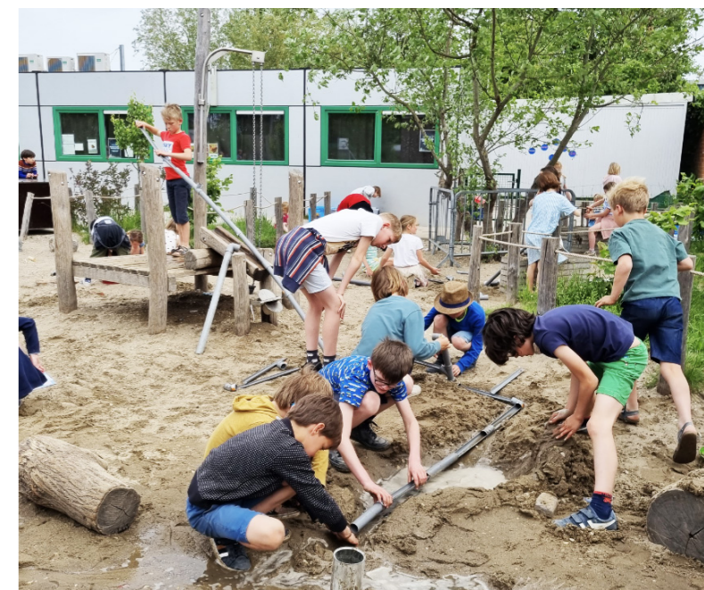
Projekt ocenený v rámci NEB Prizes 2023