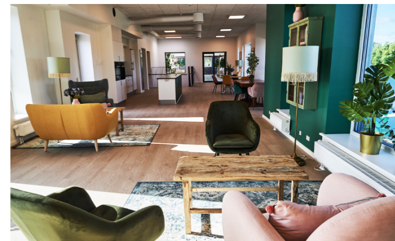
Projekt ocenený v rámci NEB Prizes 2023

Foto: Aalborg East: From isolated to inclusive