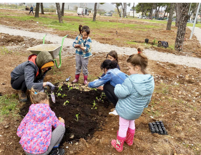
Komunitná záhrada v Podgorici, NEB cena 2023

Foto: Aalborg East: From isolated to inclusive