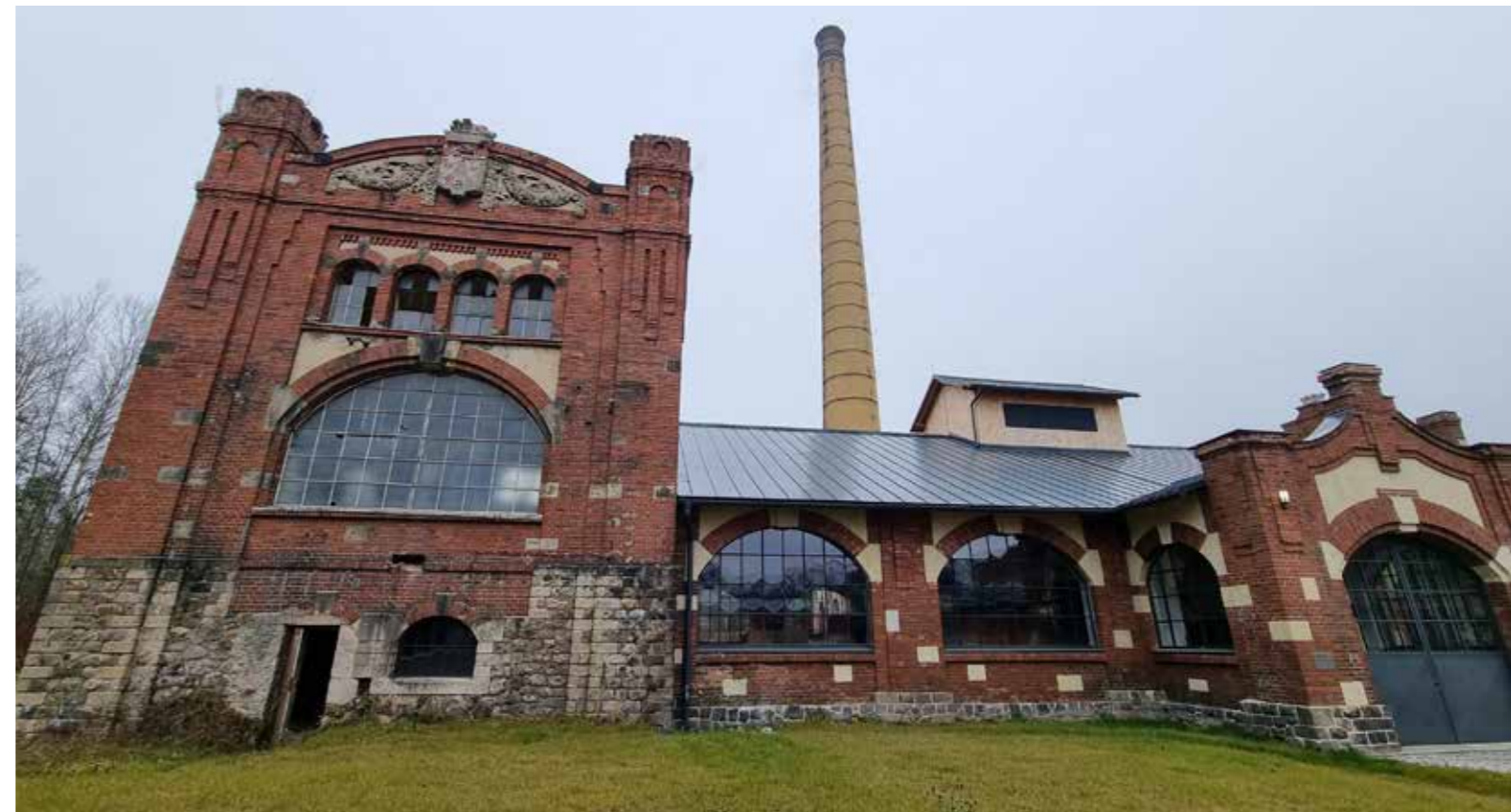
Bývalá textilní továrna Chrastava

Z hlediska celkového počtu lokalit jsou v Národní databázi nejvíce zastoupeny brownfieldy zemědělské (31 %). S malým odstupem následují brownfieldy vojenské a průmyslové (shodně 28 %). Areálů bývalých továren a výrobních podniků je napříč regiony Česka velmi mnoho, a tak průmyslové brownfieldy zaujímají v součtu největší rozlohu (34 %). Ve srovnání s tím je nevyužitých lokalit, které jsou původně určeny k vojenským účelům (včetně kasáren, střelnic apod.) poměrně málo (6 %). Často se však jedná o rozsáhlé lokality. Od roku 2019 v databázi výrazně stoupl počet brownfieldů, jejichž charakter spadá do občanské vybavenosti, jako například kulturní domy, objekty služeb, obchody (19 %). Obvykle jde o tzv. dotační brownfieldy, které do databáze registrují zástupci municipalit za účelem získání veřejné podpory na jejich revitalizaci. Je patrné, že jde o velký počet rozlohou menších objektů, neboť v součtu zaujímají tyto lokality pouze 5 % celkové rozlohy evidovaných brownfieldů v České republice.