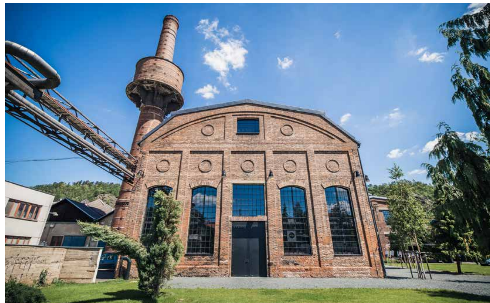
Revitalizace areálu v Libčicích nad Vltavou